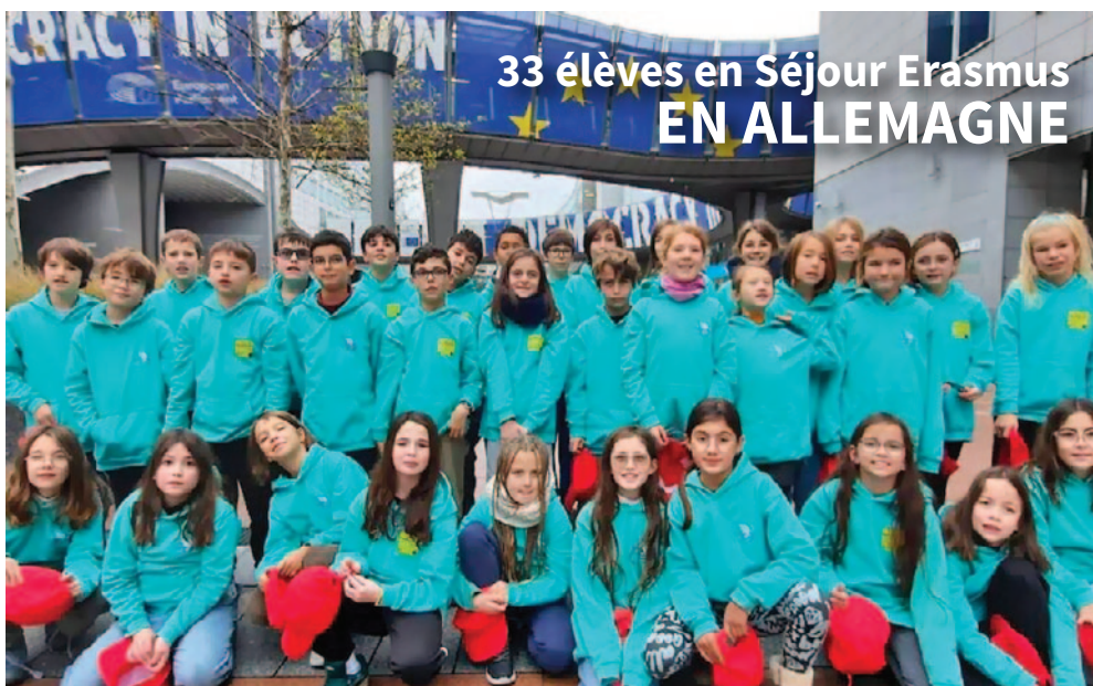
33 élèves en Séjour Erasmus EN ALLEMAGNE

Le projet Erasmus+ se poursuit tout au long de l'année, car nous recevrons à l'école une délégation d'élèves allemands et grecs au mois de mai 2026. A nous d'être à la hauteur du formidable accueil vécu en Allemagne !