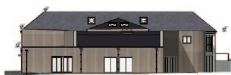
Mairie - Plan Nord

Le permis de construire doit être déposé dans les prochaines semaines. En attendant voici les plans de l'avant-projet.