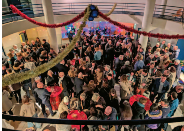
Du monde pour trinquer lors de l'apéro du 31 décembre.