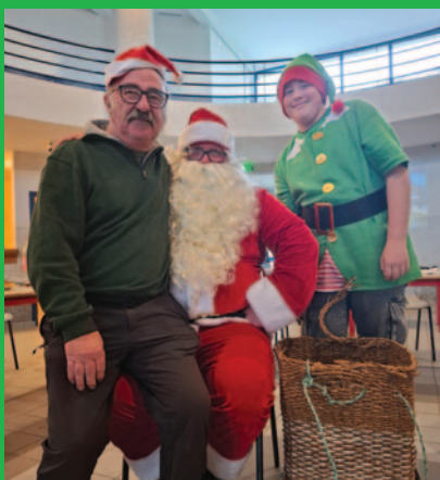
Venue du Père-Noël et de ses lutins