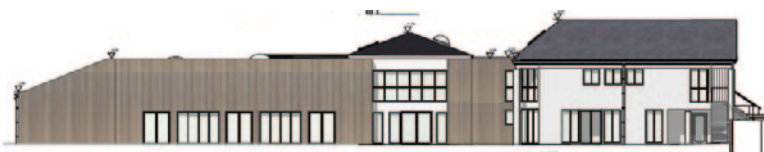
Mairie - Plan Ouest