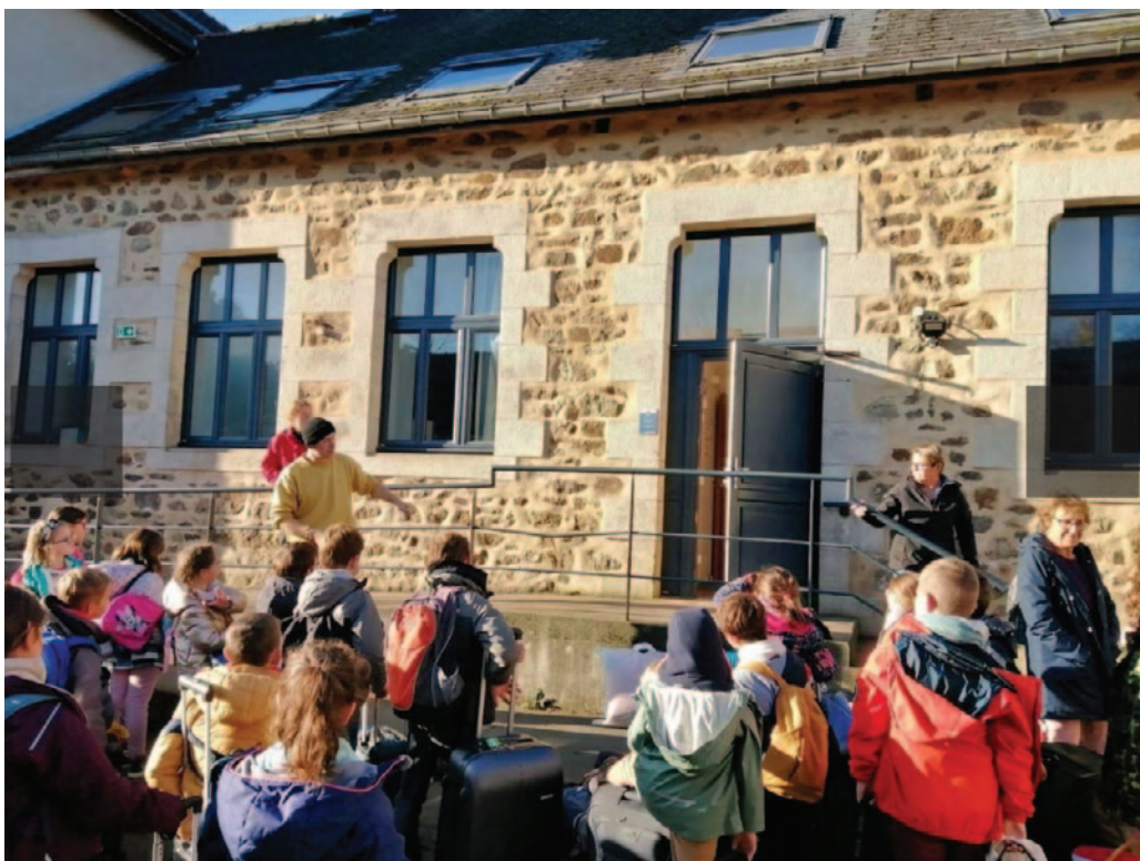
Les classes de CP, CE1, CE2 en classe verte

Cette vente a pour objectif d'aider au financement du séjour des CP CE1 CE2. Nos écoliers ont pu partir à la Chapelle Neuve dans les Côtes d'Armor, où ils ont pu découvrir la faune et la flore, fabriquer une cabane à insectes, faire des balades,