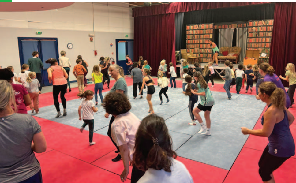
Séance zumba à la salle polyvalente

Les élèves du CP au CE2 de l'école N-D de Kerinec sont partis en classe verte à la Chapelle Neuve au centre forêt et bocage. Séjour placé sous le signe de l'éco-citoyenneté avec la découverte des animaux de la forêt, le recueil d'empreintes, la fabrication d'un hôtel à insectes, l'observation des petites bêtes du sol. Les enfants sont revenus enchantés de ce séjour plein de découvertes et en immersion dans la nature.